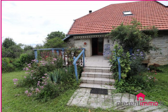
entrée et terrasse